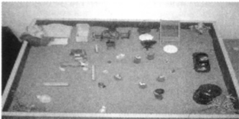
图 2 第 18 次箱庭作品主题 有意义的生日会

在结束了对小 L 的箱庭治疗后,本文作者从中抽取了儿童哀伤咨询和箱庭治疗的研究主题,并对儿童哀伤咨询、箱庭疗法的治疗理念进行了梳理,也是进行对小 W 进行箱庭治疗的理论基础。